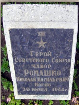
Помнік Герою ў г.Магілёве.

26 кастрычніка 1944 года Указам Прэзідыума Вярхоўнага Савета СССР Мікалаю Васільевічу Рамашка было пасмяротна прысвоена званне Героя Савецкага Саюза. Пахаваны ў Магілёве на вайсковых могілках.